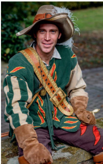
Seit 1976 wird ein junger Mann benannt, der die Stadt Soest bei repräsentativen Anlässen als Jägerkeren von Soest vertritt.

Hier lohnt es sich die Route einmal zu verlassen und eine Pause im blumenreichen Kurpark einzulegen, bevor es über die nördlichen Ortsteile Katrop und Meckingsen gemütlich zurück in die Innenstadt von Soest geht.