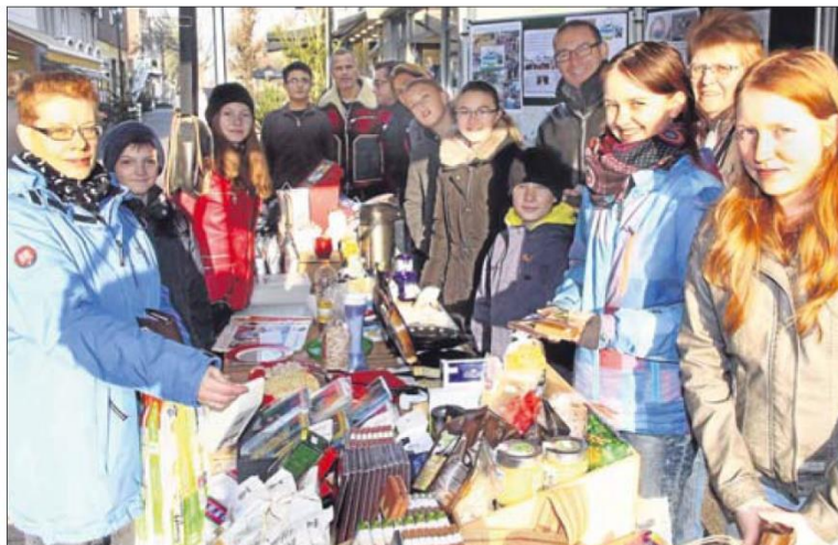
Der Eine-Welt-Kreis St. Walburga, MG-Schüler und das Café Dreiklang engagierten sich.

Aktion in der Fußgängerzone kam in nur zwei Stunden allein auf 120 Euro an Spenden