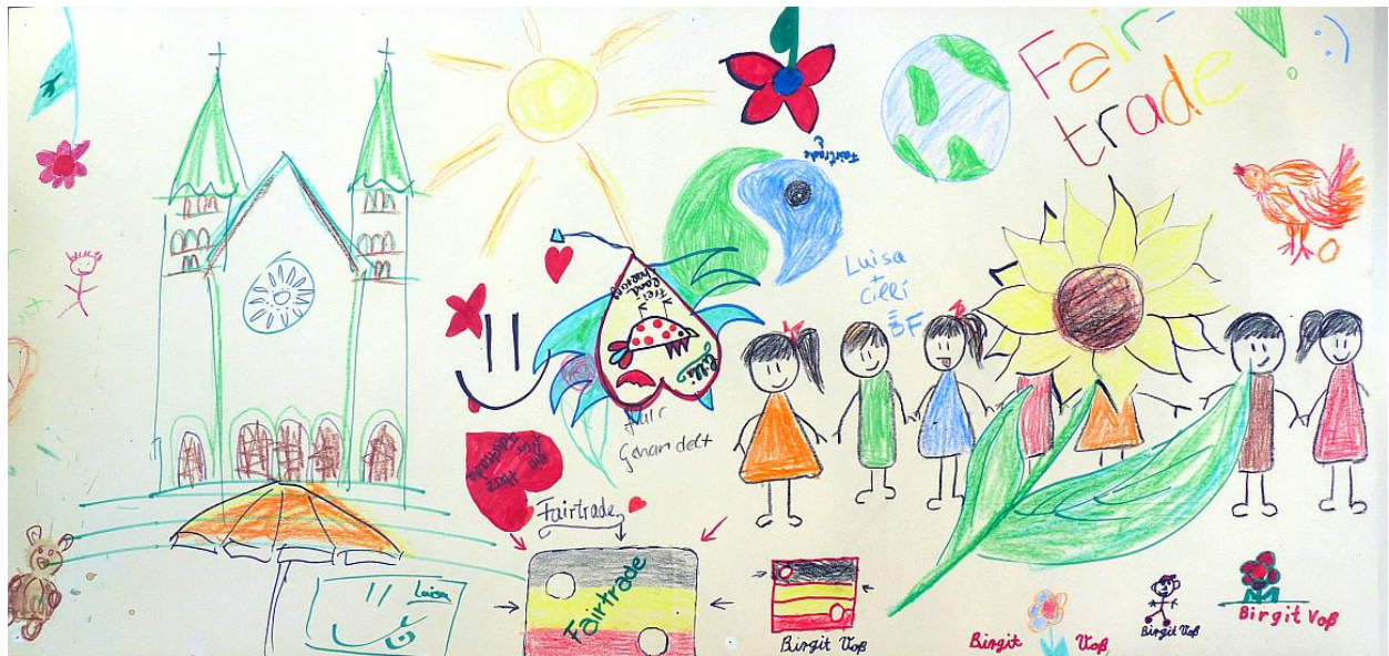
Aktionsbild von der Auftaktveranstaltung