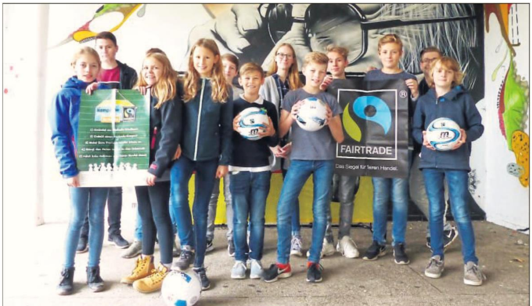
Am Freitag wird das Marien-Gymnasium zur „Fair Trade Schule“ ernannt. Diese Schüler stellen dazu fair gehandelte Produkte vor. In Zukunft soll selbst der Kaffee im Lehrerzimmer unter fairen Bedingungen erworben werden.