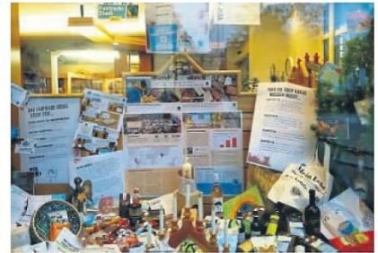
Die Ausstellung „Sweet Revolution“ im Schaufenster des Pilgebüros.

Im Jahr 2021 stellt sich die Situation ähnlich dar, erste vorsichtige Versuche für Aktionen werden jedoch unternommen.