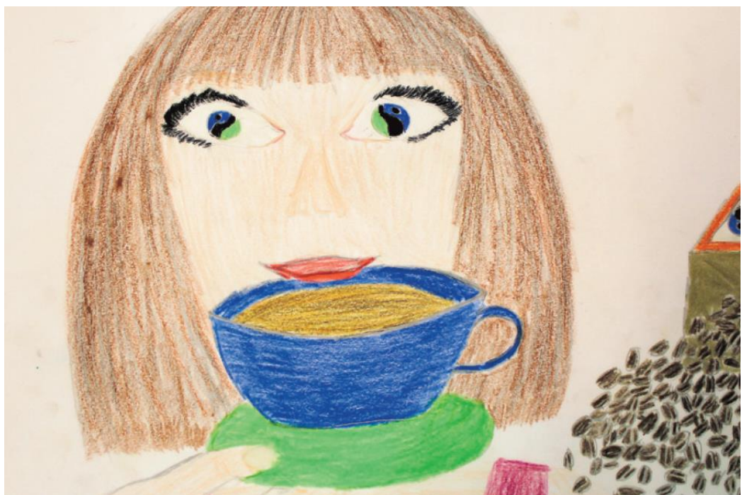
Bild aus der Malschule zur Auftaktveranstaltung

16.12.2023 „Fairtrade-Hütte“ auf dem Adventsmarkt mit, Mariengymnasium + Steuerungsgruppe Fairtrade